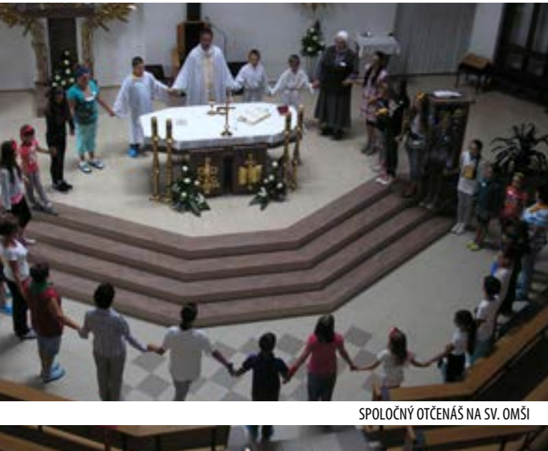
SPOLOČNÝ OTČENÁŠ NA SV. OMŠI