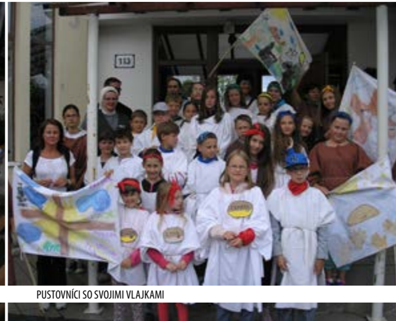
PUSTOVNÍCI SO SVOJIMI VLAJKAMI

Po roku naša fara v Novom Smokovci opäť zvláštne ožila. Mohli za to deti, ktoré denne prichádzali do farského letného tábora. Posledný júlový týždeň patril starším táborníkom. Od prvého dňa sme sa spolu spoznávali a spriatelili nielen medzi sebou navzájom, ale aj so svätými, ktorí nás sprevádzali celým táborom. Boli to pustovníci sv. Andrej Svorad a Benedikt, priateľ mladých don Bosco, milovník prírody, človeka a Boha sv. František a obetavá,