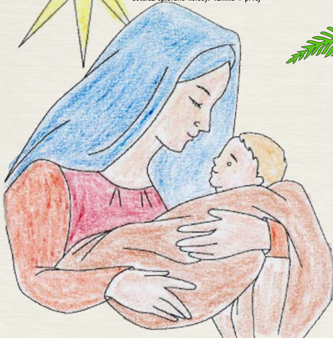
Barbora Budajová, 2. A