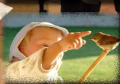
Deti sú nádejou