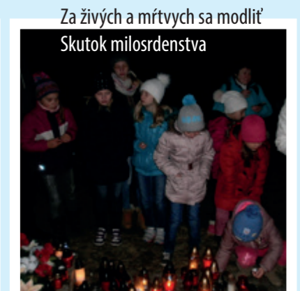
Za živých a mŕtvych sa modliť Skutok milosrdenstva