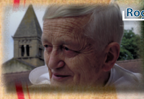
Roger Louis Schütz