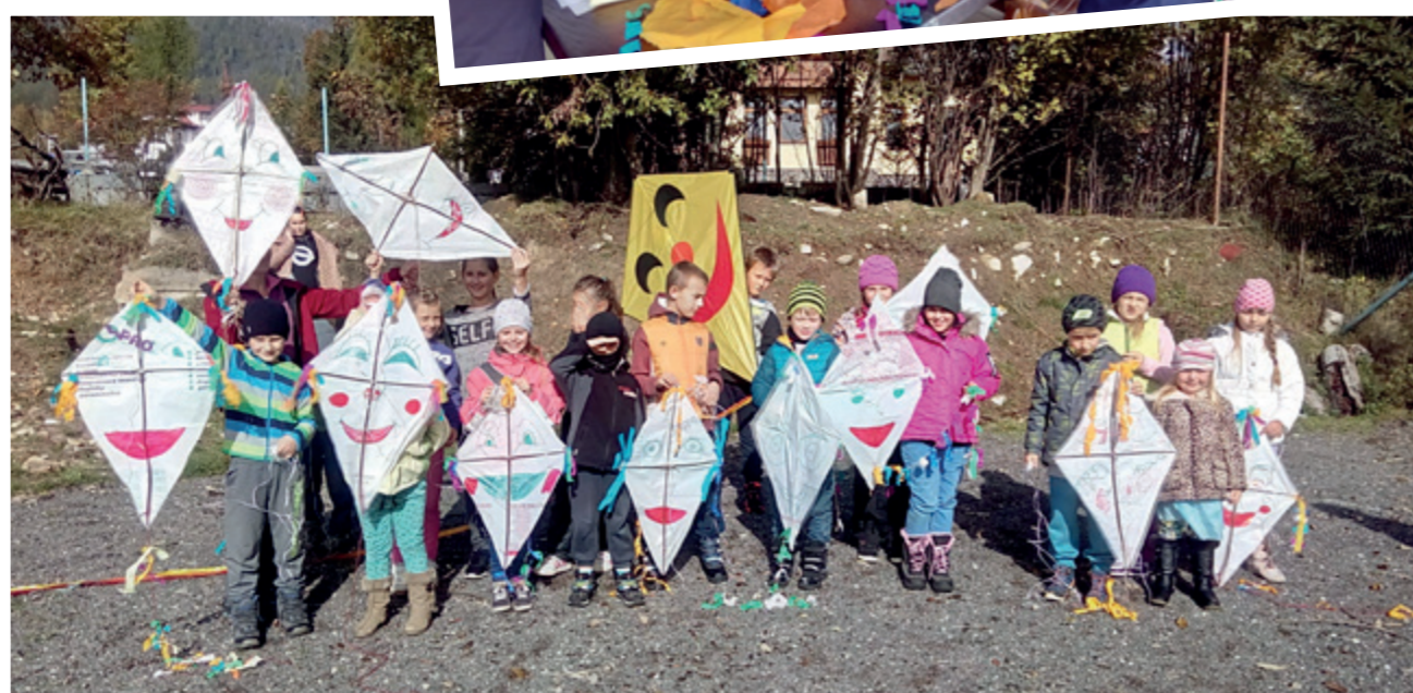
Všetky naše vyrobené veselé šarkany