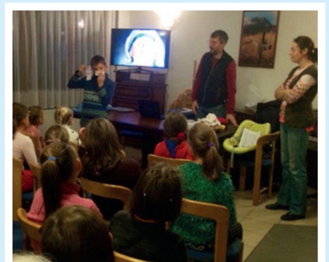
Prezentácia o skutkoch lásky Matky Terezy v Indii

V decembri sa pokúsime vyrobiť adventný veniec a vianočné ozdoby, ktoré použijeme 16.12.2016 na ozdobenie stromčeka na fare. 9.12.2016 nás čaká príchod Mikuláša. 26.12.2019 po sv. omši o 17.00 hod. sa pripravujeme na jasičkovú pobožnosť. Hneď po nej bude teplý čajik a koláčiky pri fare, kde bude aj vianočný bazár. Na