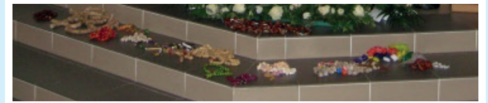
Všetky ružence, ktoré boli vyrobené a odovzdávanie darčiekov

Zapojili sme sa aj do tohtoročného Detského činu pomoci, celoslovenskej kampane motivujúcej deti k skutkom nezištnej pomoci. Nechceme o milosrdenstve iba rozprávať, ale chceme svojimi skutkami prejavovať milosrdenstvo tým, ktorí to potrebujú. Aj preto sme si na advent pripravili zbierku pomoci.