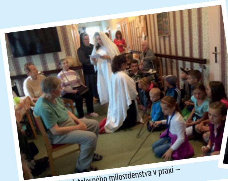
Skutok telesného milosrdenstva v praxi – návšteva starkých

a Viktor nám porozprávali o ich misii v Indii, dvakrát sme navštívili starkých v Leonarde v T. Polianke, na cintoríne sme sa modlili za duše v očistci. Pomohli sme pri pečení misijných koláčikov, zasúťažili sme si na bále svätých a biblických postáv, ale stihli sme aj kadečo povyrábať a vyšantit' sa.