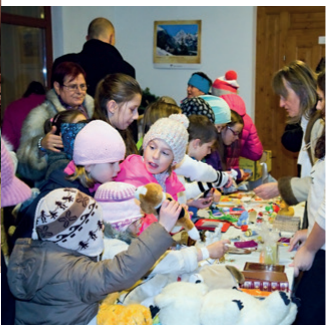
Vianočný bazár a míňanie milosrdníkov