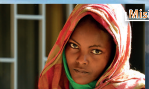
Misia v Etiópii