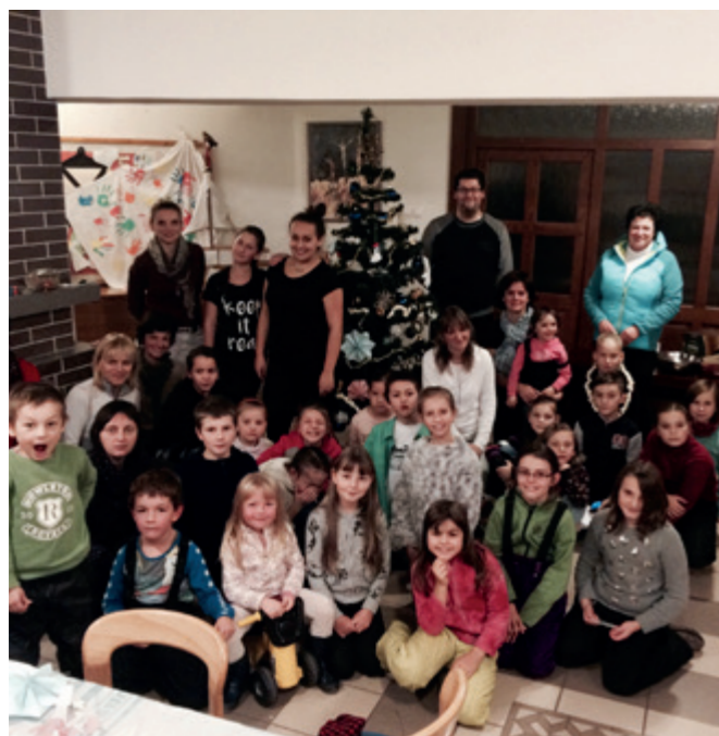
Takto krásne sme si vyzdobili náš vianočný stromček