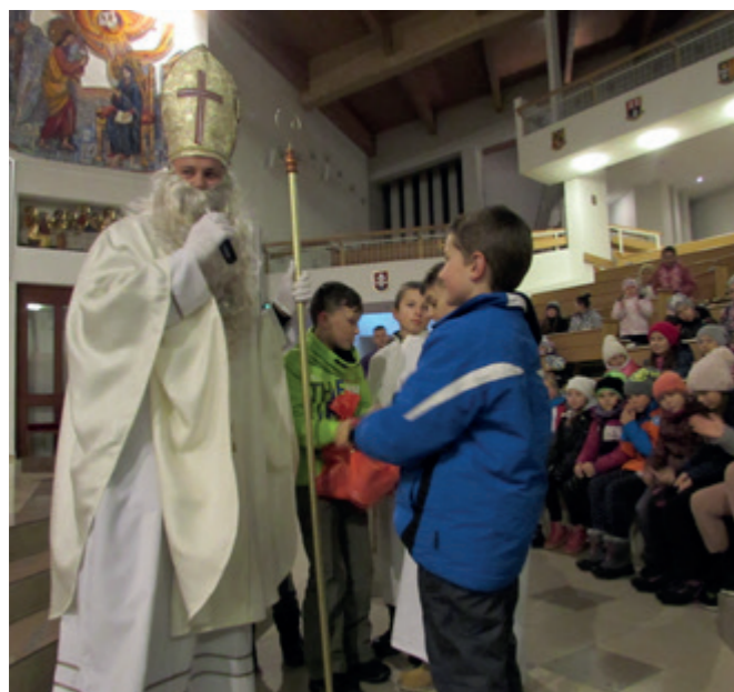
Mikuláš na sv. omši pre deti

26.12.2019 po sv. omši o 17.00 hod. bola jasičková pobožnosť a hneď po nej pri teplom čajíku vianočný bazár. To bolo radosti, míňania milosrdníkov a nakupovania. Po Veľkej noci v zbieraní mioosrdníkov pokračujeme a na poslednom stretku pred prázdninami znovu otvoríme náš bazár.