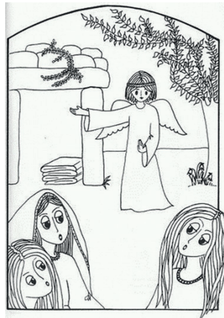
Milé deti, obrázok si môžete vymalovať.