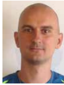
Panny Márie Bohorodičky...

V rukách držíte druhé tohtoročné číslo tatranského farského časopisu. Z tlačiarenskeho lisu zišla vianočná Ratolesť už v polovici decembra. V čase písania týchto riadkov nám zostáva len dúfať, že si ju budete môcť prelistovať už počas štvrtej adventnej nedele. Alebo aspoň na Štedrý deň, ak budú kostoly otvorené. Alebo na Nový rok, kedy si pripomínáme slávnosť